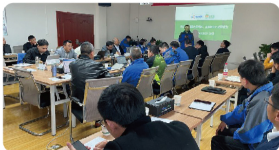
汉世伟鄂湘赣大区一季度生产经营工作汇报

为促进鄂湘赣大区组织融合，提升大区关键岗位人员管理能力和经营能力，大区在3月29日-30日组织了鄂湘赣大区各场长、主任胜任力述职及2022一季度生产经营工作汇报。