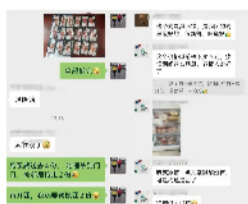
消费者对拾分味道产品的认可

在多方共同努力下，天邦拾分味道品牌猪肉也获得了上海消费者的认可。“这个肉是真不错，是我团的肉里面最好的，很新鲜、味道好”；“这个价格以前根本买不到，疫情期间这么划算，老板人太好了”；“大家晒做的红烧肉，都说香”——能够及时缓解市民“抢菜”压力，满足日常饮食需求，为客户解决难题，这也正是天邦拾分味道企业的宗旨。