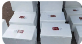
泡沫箱+冰袋延长保鲜

在此过程中，生产管理者及合作伙伴始终站在客户角度想问题，积极出谋划策，不断改进工作方法及配送方案。4月气温迅速回升，天邦拾分味道采取泡沫箱+冰袋的包装形式进行配送，妥善解决了生鲜产品脱冷时间过长而产生的变质问题，把新鲜、美味猪肉交到客户手中。