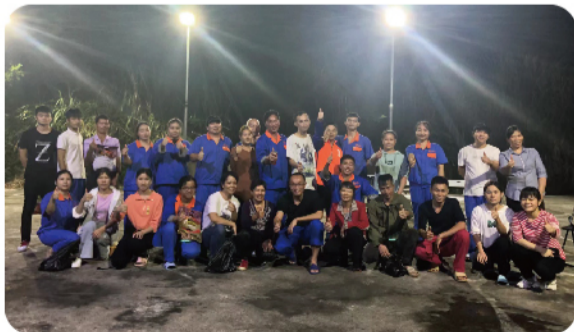
2022年潘总参与六也母猪场团队建设

“长风破浪会有时，直挂云帆济沧海”。我们相信，在“美好食品缔造幸福生活”愿景感召下，我们天邦这艘行业巨轮，必将一路劈波斩浪、行稳致远！