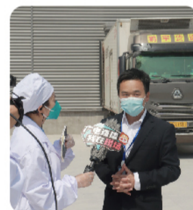
工厂物流经理接受采访