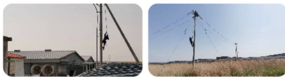
(汉世伟 东德大区 公共事务部 袁德玉)

因此，对于搭建在生产区的鸟窝更要及时处理，在确保安全用电的同时也要是为猪场防疫做好工作。我相信“功夫不负有心人”只要我们现场处理及时，可以保证鸟类也会感觉到疲惫吧，是不是以后可以鸟儿不在我们猪场的电线路上再“安家”。