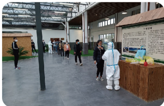
办公区人员核酸检测

一是做好个人防护，将安全放于首位。疫情发生后，公共事务部、运营督导部与单位驻地政府部门建立了紧密联系，第一时间掌握疫情动态，和疫情管控措施，同时为保障隔离人员安全，准确对接镇政府的核酸排查工作，做到了不漏一人。