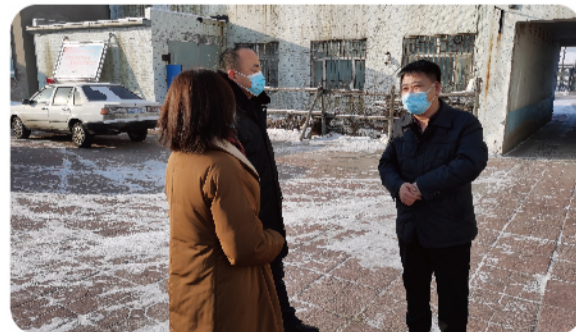
协调沟通镇政府工作