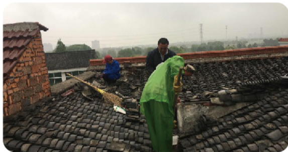
桐乡场员工在房屋屋顶开展修缮工作

桐乡场专项劳动竞赛的开展，不仅加强了团队的凝聚力和协作能力，也彰显了员工爱岗敬业、勇创一流的主人翁风采。相信在大家的共同努力下，我们的场区管理和经营业绩一定会越来越好！