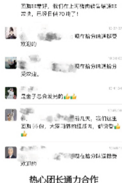
热心团长通力合作

在多方共同努力下，天邦拾分味道品牌猪肉也获得了上海消费者的认可。“这个肉是真不错，是我团的肉里面最好的，很新鲜、味道好”；“这个价格以前根本买不到，疫情期间这么划算，老板人太好了”；“大家晒做的红烧肉，都说香”——能够及时缓解市民“抢菜”压力，满足日常饮食需求，为客户解决难题，这也正是天邦拾分味道企业的宗旨。