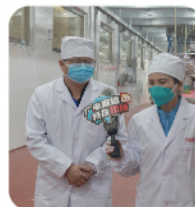
食品安全部经理接受采访