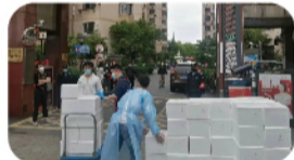
团购物资配送至小区