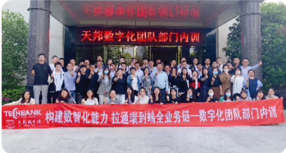
数字化团队内训合影

为构建数智化能力，拉通端到端全业务链，进一步打造高绩效团队，天邦股份数字化团队于4月24日在浦口龙隐文化园开展部门内训，本次培训共计60余人参加。