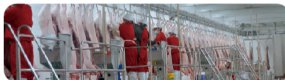
阜阳天邦临泉工厂屠宰车间

阜阳天邦临泉工厂，设计年屠宰及深加工500万头生猪，是目前国内单体最大的屠宰加工工厂。工厂采用国际先进的生产设备和管理流程，配以信息化技术运用，使得上游可追溯到养殖端，下游可追溯到终端产品，确保全产业链的食品安全。